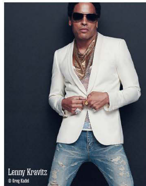
Lenny Kravitz

Po nekajletnem zatišju se Lenny Kravitz vrača na koncertne odre. Talentiran in očesu prijazen pevec se je zadnjih nekaj let posvečal igri in dobrodelnosti, konec meseca septembra pa izdal svoj deseti studijski album in krenil na turnejo. Album nosi ime Strut in na njem se nahaja dvanajst njegovih novih stvaritev. Uspešnica The Chamber se že pridno vrti na naših radijskih postajah. Le-to in singel Sex je Lenny objavil kot napoved prihajajočega albuma. Od 23. septembra je album že v celoti na voljo, sam pa je krenil tudi na evropsko turnejo, ki jo začne v ruski Moskvi. Nam najbližje se bo ustavil na Dunaju. Za njegove koncerte je značilno, da so nabiti z odlično energijo in da ga vedno spremljajo zelo dobri glasbeniki. Njegova odrska prezenca prepriča tudi tiste, ki misijo, da je Lenny Kravitz zgolj "lep obraz", vendar je teh vedno manj. Tudi ta turneja ima potencial, da postane klasika. Poleg novih uspešnic bo z gotovostjo zapel tudi nekaj uspešnic iz prejšnjih let, saj ima zavidanja vreden in bogat repertoar. Uspešnice, kot so Are You Gonna Go My Way , Thinking of You , Belive , Again in mnoge druge, se bodo prav gotovo našle na seznamu. Mogoče v drugačni preobleki, pa vendar še vedno odlične. Cena aranžmaja: od 106,99 evra do 131,99 evra.