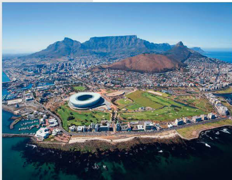
Cape Town, Južnoafriška republika

in žal, po ne ravno briljantni predstavi na prvenstvu, tudi pekoča rana Carioc – prebivalcev Ria de Janeira.