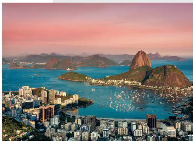
Rio de Janeiro, Brazilija

pasjo vprego in še ogromno drugih zimskih radosti. Kulturno ponudbo lahko preverimo na čudoviti ulici Grande Allée in v trendovskem predelu Saint-Roch, ker pa je, kjerkoli so svoj pečat pustili Francozi, dobra kuhinja ravno tako pomembna kot kulturno dogajanje, se v starem delu mesta lahko okrepcamo v več kot stotih restavracijah, vrhunsko sprostitve pa si lahko privoščimo v enem najboljših hotelov v mestu – Auberge St-Antoine. www.quebecregion.com