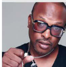
Jeffrey Allen Townes (aka Jazzy Jeff)

29. oktobra ob 22. uri, Klub Cirkus, Trg mladinskih delovnih brigad 7, Ljubljana www.cirkusklub.si