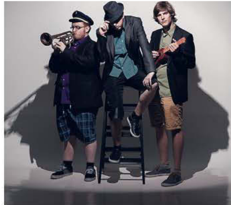
Odbiti boji za impro prestol se bodo odvijali v sodelovanju gledališča IGLU s SiTi Teatrom.

V Slovenijo z letošnjo jesenjo prihaja Maestro™. Gre za licenčni format improvizacijskega tekmovanja, ki v tujini (predvsem po Severni Ameriki in Evropi) gledališke dvorane polni tako z obiskovalci kot s solzami in bolečimi trebuhi – od smeha, seveda! Odpuljen spopad za impro prestol se bo pri nas prvič odvil 21. oktobra v SiTi Teatru, v udobju gledaliških sedežev in dobre mere smeha pa se bomo zatem lahko sprostili še vsak tretji torek v mesecu. V večeru, ki bo poln spontanosti in vzponov in padcev izkušenih improvizatorjev, se jih bo pod taktirkama dveh režiserjev kar trinajst potegovalo za ugledni naslov najboljšega improvizatorja večera. Pri tem pa bomo seveda aktivno sodelovali tudi gledalci: prizori na odru se bodo namreč odvijali glede na naše predloge, prav tako pa bodo improvizatorji prepuščeni na milost in nemilost našega ocenjevanja. Iz kroga v krog bodo