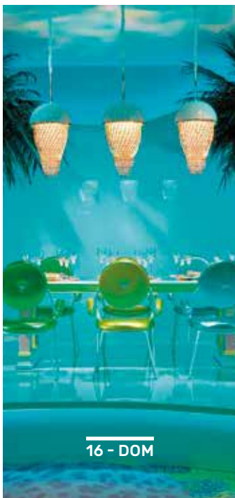
16 - DOM