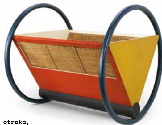
Zibelka za otroka, oblikovanje Peter Keler, 1923