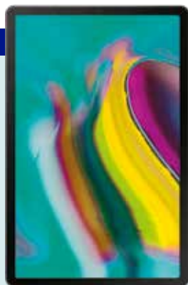
SAMSUNG Tanka in lahka tablica Galaxy Tab S5e (2019) samsung.si 459,90 €