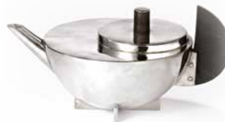
Infuzor za čaj, oblikovanje Marianne Brandt, 1924

Ustvarjalna atmosfera Bauhauusa je bila pravi magnet za ljudi iz več kot 29 držav. Nekateri niso imeli niti prebite pare, drugi so imeli ravno dovolj, da so pomagali svojim kolegom. A ena stvar jim je bila skupna: vsi so bili t. i. »bauhäuslerji« in vedno bodo! Med vidnejše ustvarjalce tistega časa sodijo Wilhelm Wagenfeld, Herbert Bayer, Josef in Annie Albers, Marcel Breuer, Marianne Brandt, Wassily Kandinsky, Paul Klee, Mies van der Rohe in László Moholy-Nagy. Tudi Slovenci smo imeli dva vidnejša zagovornika Bauhauusa – slikarja Avgusta Černigoja, ki je nekaj časa celo obiskoval šolo v Weimarju, in arhitekta Edvarda Ravnikarja.