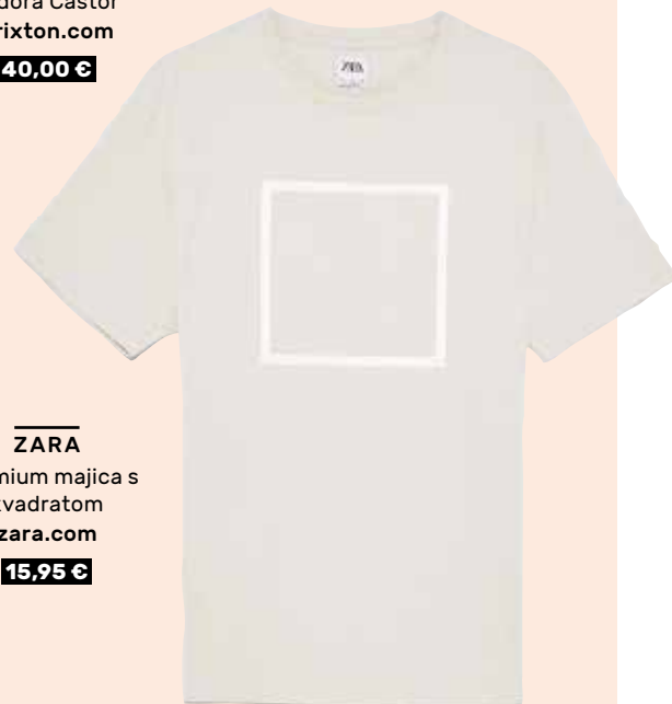
ZARA Premium majica s kvadratom zara.com 15,95 €