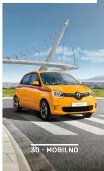
30 - MOBILNO