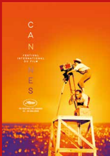
Foto: La Pointe courte / 1994, Agnès Varda in otroci - Montaža in dizajn: Flore Maquin

MEDNARODNI FILMSKI FESTIVAL V CANNESU, KI VELJA ZA ENEGA NAJPRESTIŽNEJŠIH IN NAJPOMEMBNEJŠIH FILMSKIH FESTIVALOV NA SVETU, LETOS POTEKA MED 14. IN 25. MAJEM.