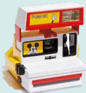
POLAROID ORIGINALS Retro polaroidna kamera Polaroid 600 s kultno Miki miško polaroidoriginals. com 190,00 €