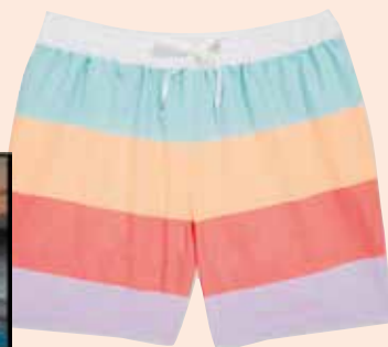
CHUBBIES Kopalke The Flavor Savers chubbiesshorts.com 62,00 €