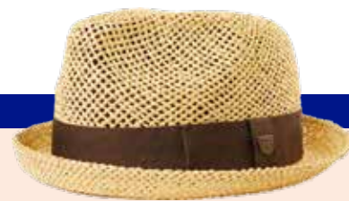
BRIXTON Slamnati klobuk fedora Castor brixton.com 40,00 €