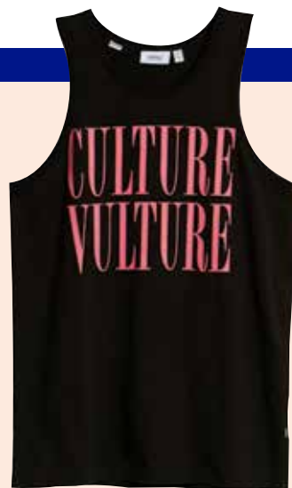
WESC Majica Culture Vulture shopwesc.com 43,00 €