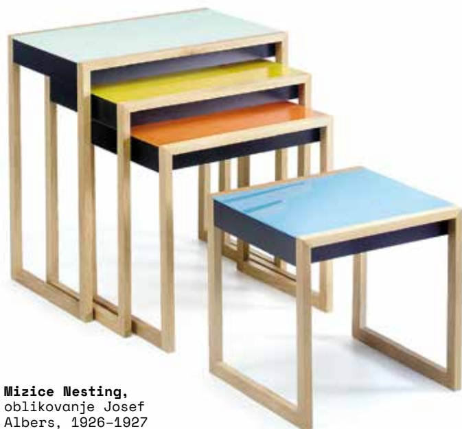
Mizice Nesting, oblikovanje Josef Albers, 1926-1927