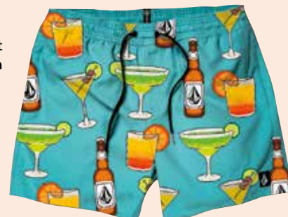
VOLCOM Kopalke 8 bit volcom.com 43,00 €