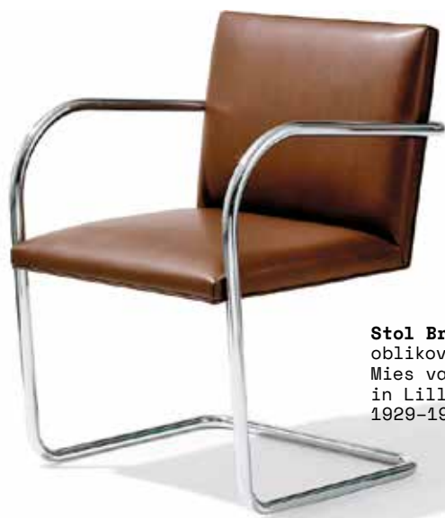
Stol Brno, oblikovanje Mies van der Rohe in Lilly Reich 1929-1930

Nauki Bauhauusa in dela študentov so še danes ikonični. »Čeprav je obstajala le 14 let, legendarna šola oblikovanja ni nikoli izgubila svojega vpliva in še danes velja za enega najpomembnejših nemških kulturnih izvozov«.