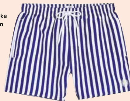
TOPMAN Črtaste kopalke topman.com 24,00 €