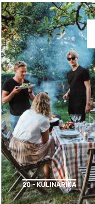
20 - KULINARIKA