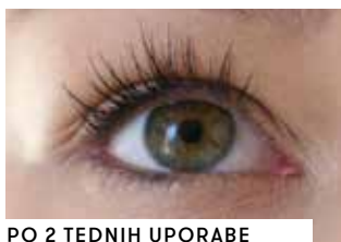
PO 2 TEDNIH UPORABE SERUMA ZA RAST TREPALNIC

Izdelek sem nanašala vsako jutro in vsak večer, saj sem se res veselila rezultata po 4 tednih testiranja. Zjutraj, ko sem umila obraz, sem serum nanese na si med tem umila zobe, nato pa pričela z nanašanjem make upa. Všeč mi je tudi dejstvo, da lahko serum uporabljáš sočasno z ostalimi ličili in si tako vedno videti urejeno.«