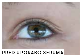
PRED UPORABO SERUMA ZA RAST TREPALNIC

»Takoj, ko sem odprla paket, sem ugotovila, da ima proizvod odličen aplikator in da je super pakiran. Najbolj sem se bala prvega nanašanja, saj me je skrbelo, da bo dražil moje oči, da me bodo le-te srbele, se solzile ali karkoli podobnega. Že pri prvem nanosu sem ugotovila, da moje oči serum izjemno dobro prenašajo, in to je 4-tedensko testiranje le potrdilo.«